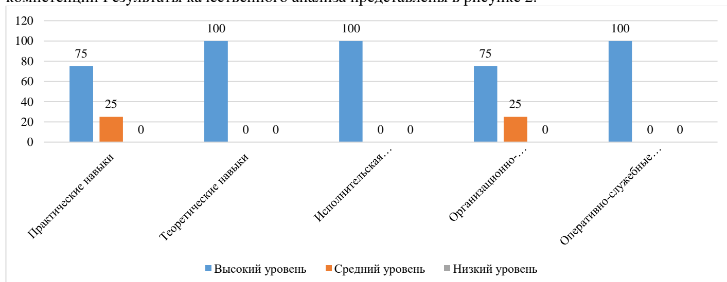
Рисунок 2 – Анализ удовлетворенности работодателей качеством образования по образовательной программе 44.02.02 Правоохранительная деятельность

Качественный анализ ответов респондентов позволяет сделать вывод, о том, что наиболее высокий уровень прослеживается в сформированности теоретических знаний, исполнительской дисциплины, оперативно-служебных компетенций. В единичных случаях работодатели отмечают средний уровень сформированности практических навыков и организационно-управленческих компетенций. Результаты качественного анализа представлены в рисунке 2.