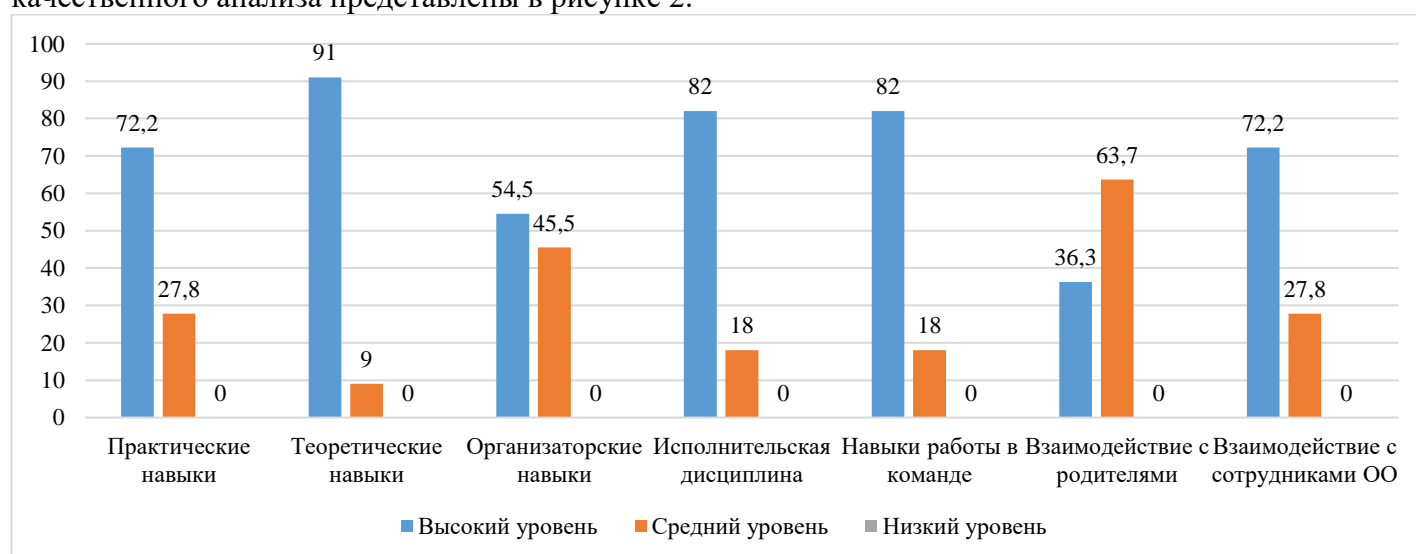
Рисунок 2 – Анализ удовлетворенности работодателей качеством образования по образовательной программе 44.02.04 Специальное дошкольное образование

Качественный анализ ответов респондентов позволяет сделать вывод, о том, что наиболее высокий уровень прослеживается в сформированности теоретических навыков, навыков работы в команде, исполнительской дисциплины. Достаточно высоко работодатели оценивают навыки взаимодействия с сотрудниками, практические, организаторские навыки выпускников. Низкие показатели прослеживаются в навыках взаимодействия молодых специалистов с родителями. Причиной сложностей во взаимодействии с родителями может являться возрастная разница, прохождение адаптационного периода, отсутствие собственного родительского опыта. Результаты качественного анализа представлены в рисунке 2.