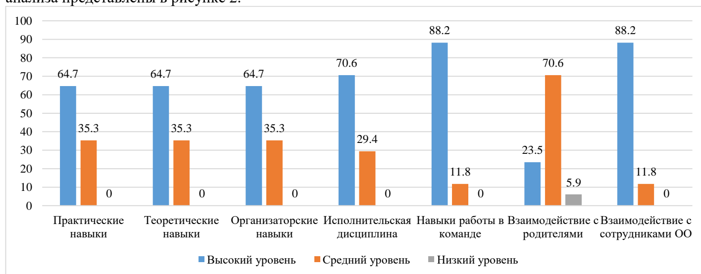
Рисунок 2 – Анализ удовлетворенности работодателей качеством образования по образовательной программе 49.02.01 Физическая культура

Качественный анализ ответов респондентов позволяет сделать вывод, о том, что наиболее высокий уровень прослеживается в сформированности навыков взаимодействия с сотрудниками, исполнительской дисциплины, работы в команде. Достаточно высоко работодатели оценивают теоретические, практические, организаторские навыки выпускников. Низкие показатели прослеживаются в навыках взаимодействия молодых специалистов с родителями. Причиной сложностей во взаимодействии с родителями может являться возрастная разница, прохождение адаптационного периода, отсутствие собственного родительского опыта. Результаты качественного анализа представлены в рисунке 2.